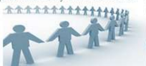
Figura 3: Implicancias del Modelo Educativo ICC

Selección, evaluación y perfeccionamiento de docentes acorde a los requerimientos de la formación, con base en procesos planificados y estructurados.